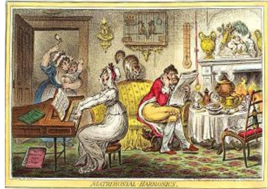
L'harmonie conjugale – avant et après.