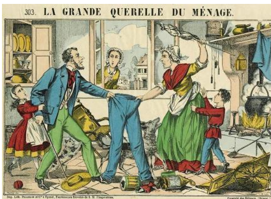
The same question on both sides of the Channel : who wears the trousers? Qui porte la culotte ?