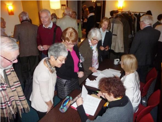
L'arrivée des membres de FGB Always a busy time