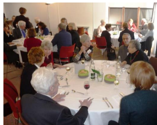
Le New Year's Lunch Entente Cordiale garantie