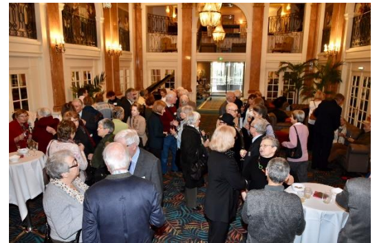
Le verre de l'amitié Cheers !