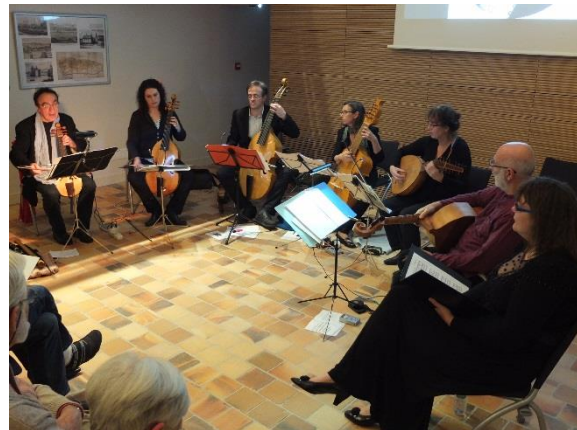
Hier et aujourd'hui. Tout change, seule la musique demeure. Five centuries later the music lives on.