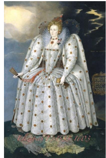
La reine qui inspira un âge d'or. A great Queen and a muse.