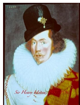
Avec ses chevaliers poètes ou musiciens, la cour d'Elizabeth était brillante. Elizabeth's court sparkled with knightly poets and musicians.