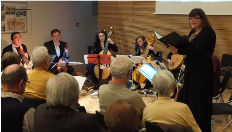
Les musiciens nous ont transportés au 16 ème siècle. The old instruments created a true Elizabethan atmosphere.