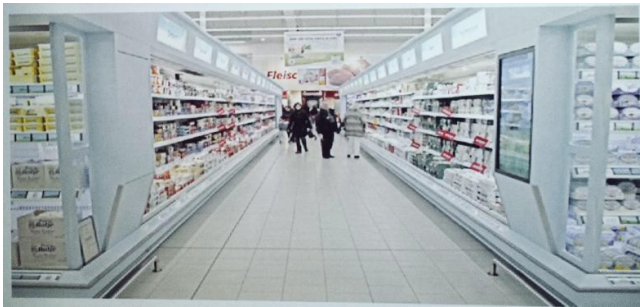
Le supermarché étant aujourd'hui un lieu universel, son décor remplace les rues de Venise