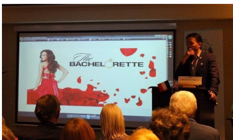
The casket scene is played against the background of a TV dating game show