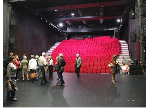
Visite du Théâtre Olympia à Tours à l'occasion de la représentation du Marchand de Venise Called « Business in Venice » the play was translated and adapted for a modern audience