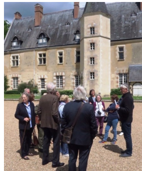
The castle belonged to Louise de Keroualle and is now privately owned.