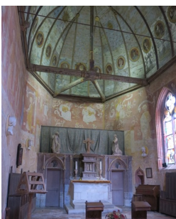
Left: the chapel is still used by the family.