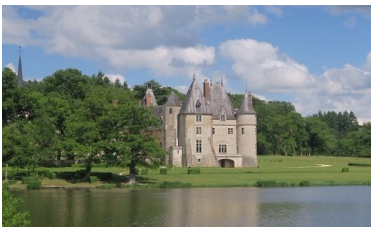
Le Château de la Verrerie, un peu de brume et on se croirait en Écosse.