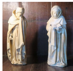
A droite: deux des trésors du château, deux pleurants en albâtre, du tombeau du duc Jean de Berry.

Une journée aussi complète et près de 7 siècles d'histoire ne peuvent être contenus dans une seule page.