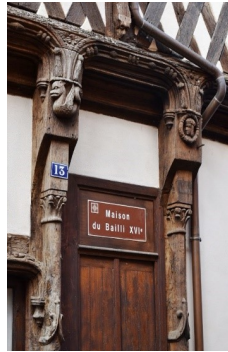
One of the many mediaeval houses.