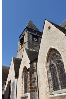
L'église Saint Martin est gothique de transition avec de superbes vitraux.