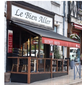
Our restaurant was very good.