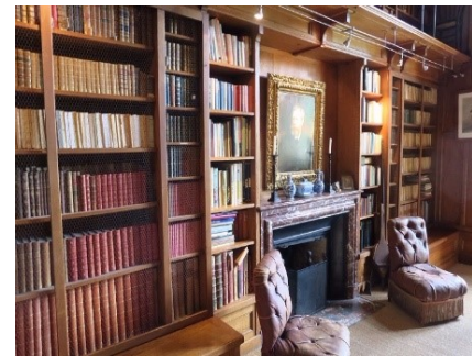
Il fait bon vivre dans ce joyau de la Renaissance, la bibliothèque appelle à la lecture.