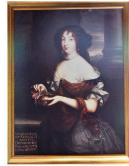
In 1673, the Stuarts having no heirs, Louis XIV gives the town to Louise de Keroualle, who was Charles II's favourite and the French king's secret agent in England.