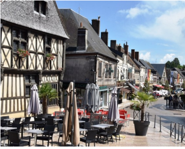
Welcome to Aubigny-sur-Nère La Cité des Stuarts