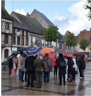
Visite de la ville sous les parapluies. Couleur locale oblige.