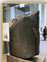
La Pierre de Rosette au British Museum